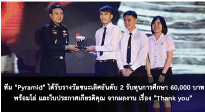
ทีม "Pyramid" ได้รับรางวัลชนะเลิศอันดับ 2 ทุนการศึกษา 60,000 บาท พร้อมโล่ และใบประกาศเกียรติคุณ จากผลงาน เรื่อง "Thank you"