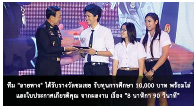
ทีม "ลายทาง" ได้รับรางวัลชมเชย ทุนการศึกษา 10,000 บาท พร้อมโล่ และใบประกาศเกียรติคุณ จากผลงาน เรื่อง "8 นาฬิกา 90 วินาที"

รางวัลจากการส่งผลงานเข้าประกวด 2 ทีม ได้แก่